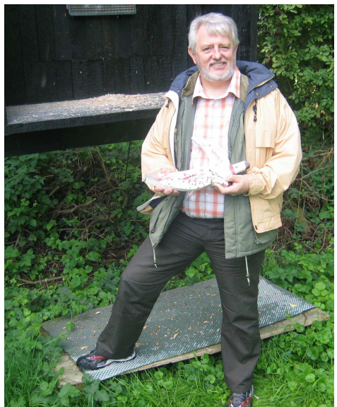
Während der Königinnenvogel noch fast vollständig herab fiel war der Königsvogel bis auf einen kleinen Rest zerlegt worden