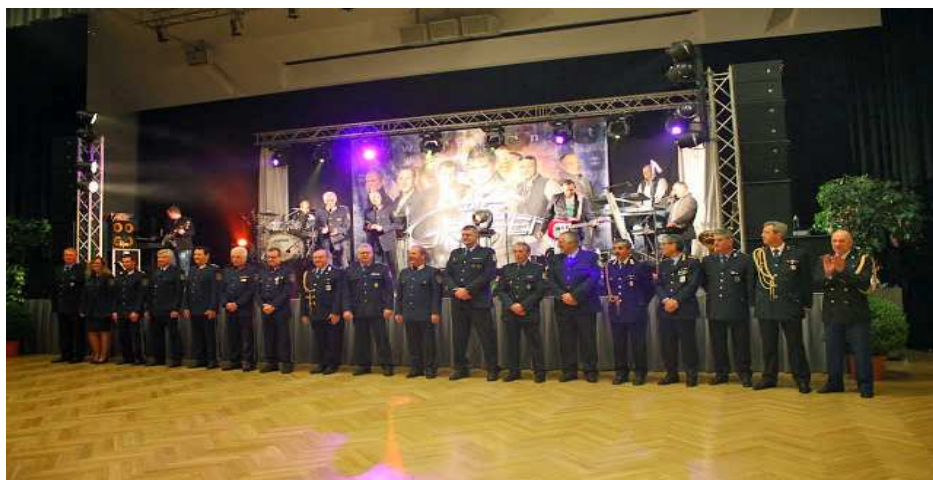
Eröffnung des 49. IPA-Balls - alles Walzer -

Um 10.00 Uhr des 01. Februar fand der Empfang bei der Bezirkshauptmannschaft Bruck/Mur-Mürzzuschlag statt, an dem eine Reihe von führenden Persönlichkeiten des öffentlichen Lebens teilnahm. Nach einer kurzen internationalen Verkehrsregelung in Kapfenberg nahmen wir über Einladung der Bürgermeister von Bruck/Mur und Kapfenberg im Gasthaus Schicker in Kapfenberg ein köstliches Mittagessen ein. Auch dabei waren zahlreiche Ehrengäste anwesend.