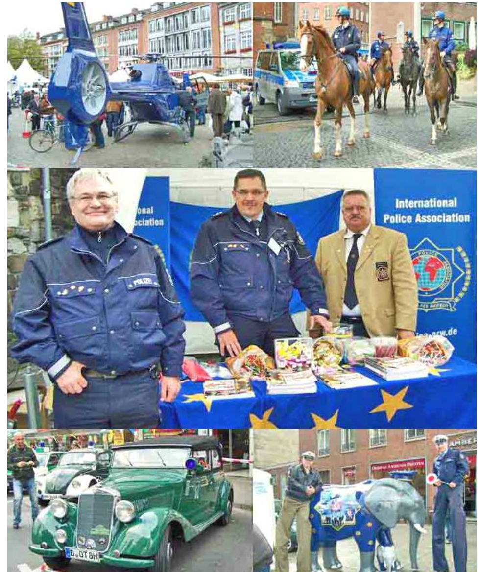
Ausstellungen und Vorführungen in der gesamten Innenstadt